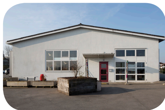
Bureau Responsable et Ateliers TEM, Route Grosse-Pierre 26