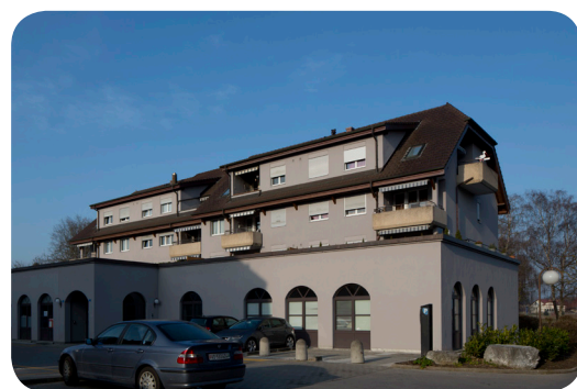
Classes-ateliers TEM, Les Sorbiers 2-4