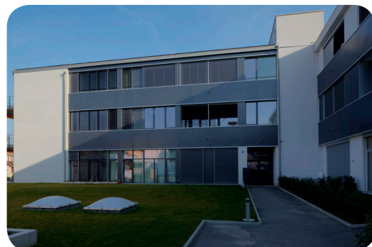
Hébergement, Rue des Terreaux 5

Les vacances scolaires sont identiques à celles des écoles publiques de Payerne. www.vd.ch/themes/formation/jours-feries-et-vacances-scolaires