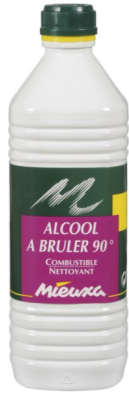
alcool à bruler