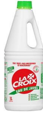
eau de Javel