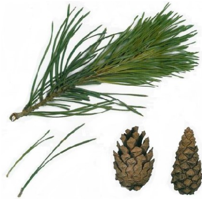
aiguilles de pin