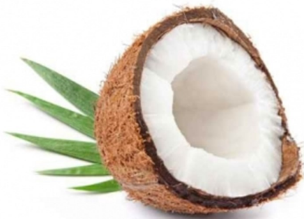
noix de coco