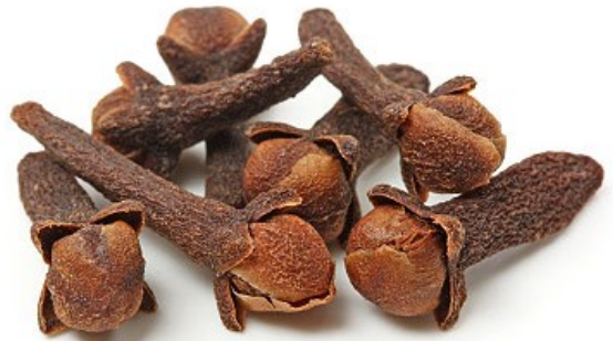
clous de girofle