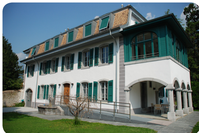
Rue de la Chapelle 5 à Aigle

L'accompagnement se fait en collaboration étroite avec les familles et avec les différents partenaires du milieu scolaire, social et de la santé.