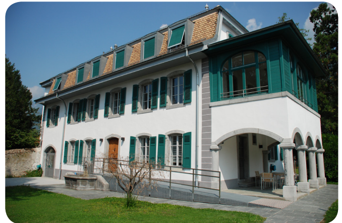
Rue de la Chapelle 5 à Aigle

2 semaines à Noël, 1 semaine à Pâques, et la dernière semaine de juin.