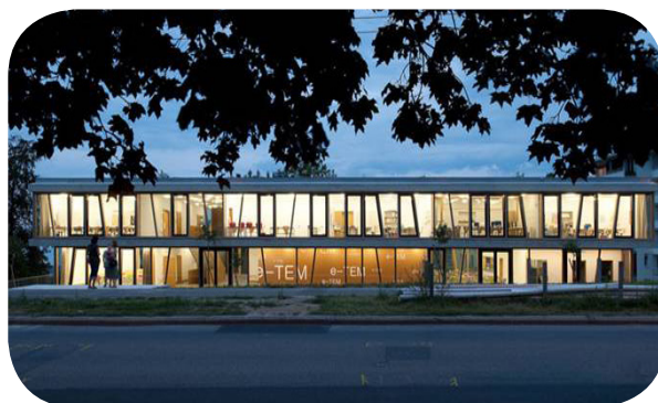
Site de Pierrefleur