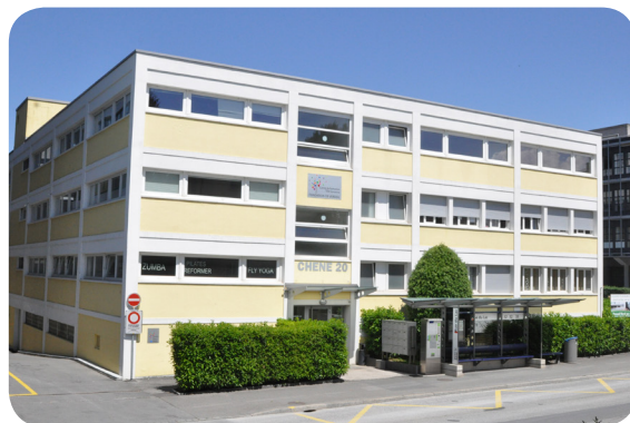
Site de Renens