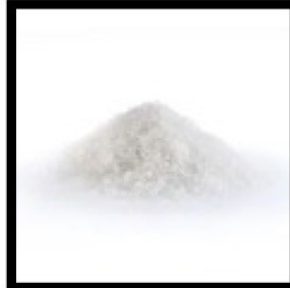
sucre 3 c.à.s