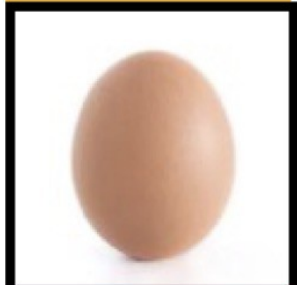
oeufs entiers 3