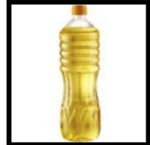
d'huile 2 c.à.s