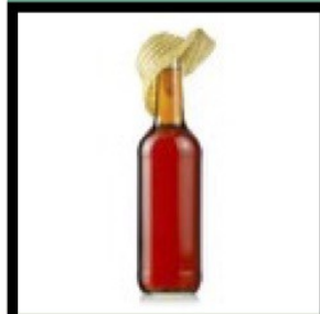
rhum 5 cl