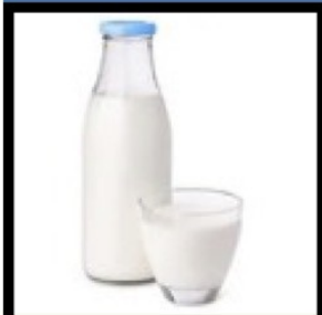
lait 60 cl