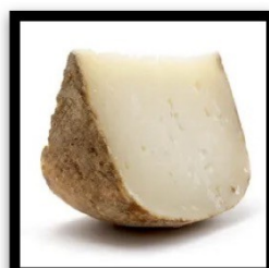
Pecorino (piquant) 50g