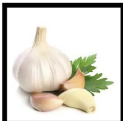
2 gousses d'ail