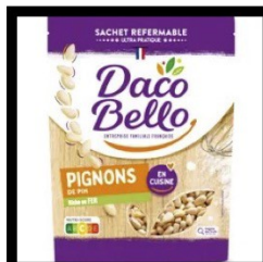
pignons de pin 100g