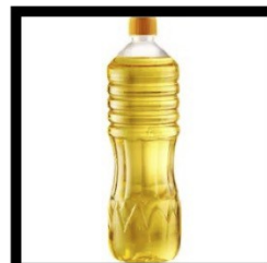
d'huile 20 cl