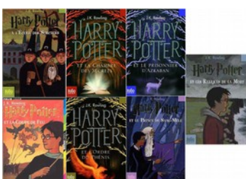
les couvertures des sept livres

Joanne Rowling ne s'attendait pas à ce que ses livres aient autant de succès. En 1998, les éditions Scholastic achètent les droits pour 105 000 $. Elle a fait une thérapie pour prendre du recul par rapport à son succès. Grâce à l'argent gagné avec ses livres, elle a quitté l'enseignement pour travailler en tant qu'écrivaine à plein temps. En 1999, elle est devenue millionnaire. Après cela, elle a eu beaucoup de propositions pour les adapter en film. Au final, c'est Warner Bros qui a récupéré les droits pour les films. Aujourd'hui, c'est devenu un succès mondial.