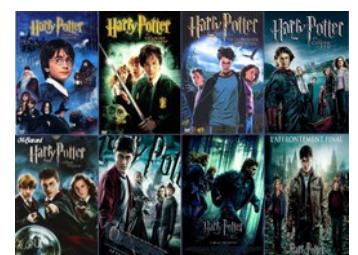
les affiches des films